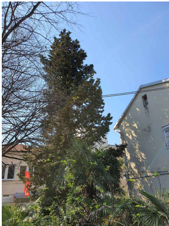
Visina stabla u odnosu na zgradu