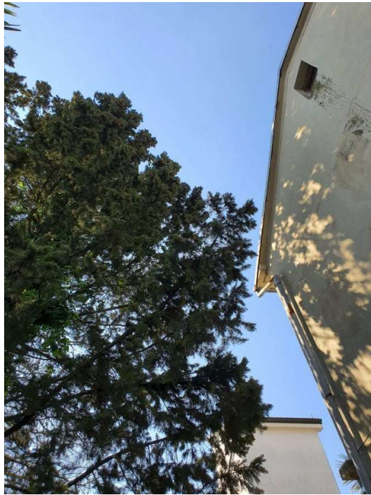
Blizina i visina stabla u odnosu na zgradu