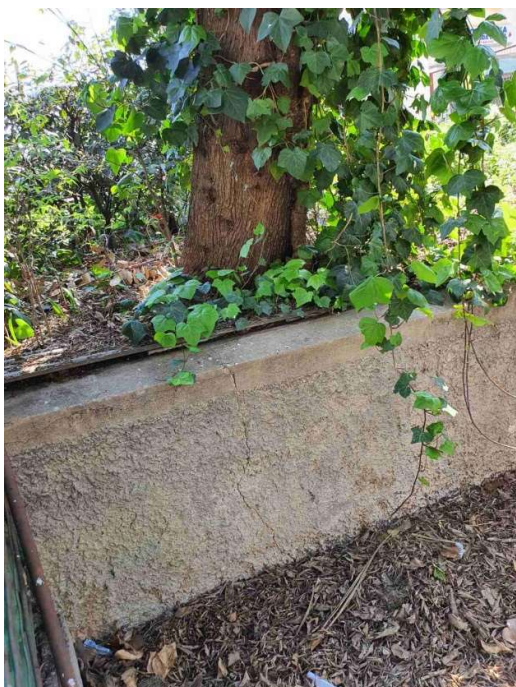
Mali potporni zid visine 1.00 m sa napuknućem.

S obzirom na sve navedenom, i opasnu situaciju koja zahtijeva hitnu intervenciju, molimo Vas hitno uklanjanje ili odobrenje za sječu predmetnog stabla.